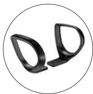
Brazos opción JACK. Brazos fijos poliamida negros.