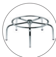
Opción Base fija de tubo de acero cromado