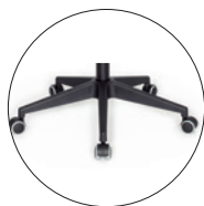
Estándar Base giratoria piramidal en poliamida negra.