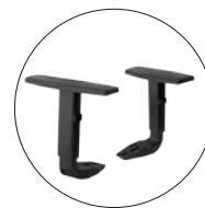
Brazos opción FRITZ. Brazos regulables en altura negros.