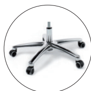
Opción Base giratoria de aluminio pulido.