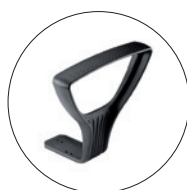
Brazos opción GOLF. Brazos fijos poliamida negros.

Metraje tapizado: 0,8 mts. Peso unidad: 14 kg Caja: 1 unidad Volumen: 0,13 m 3