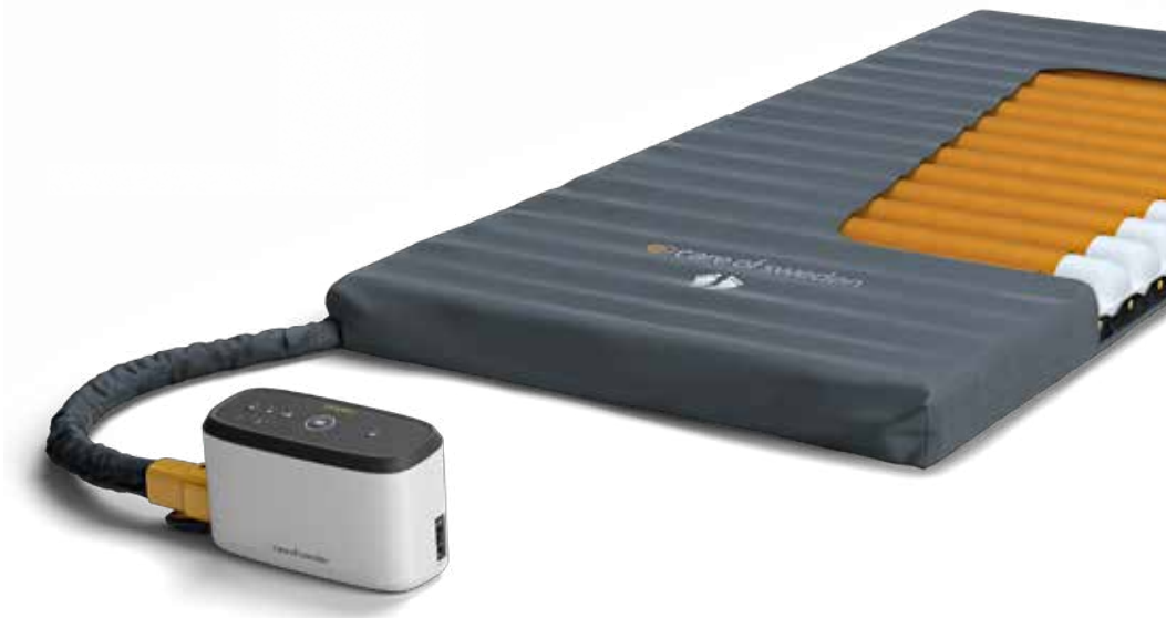
CuroCell® IQ CX10 con funda Stone